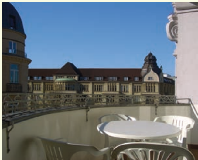
• View from a terrace •