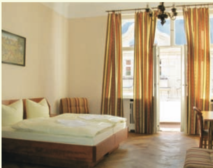
Mehrbettzimmer / twin-room