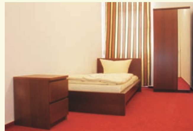
Einzelzimmer / single room