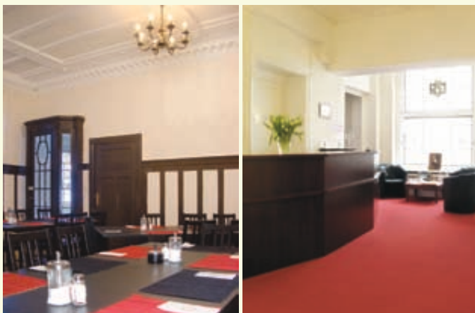
Frühstücksraum / breakfast room Empfang / reception

Brauchen Sie eine günstige und gemütliche Unterkunft zu moderaten Preisen?