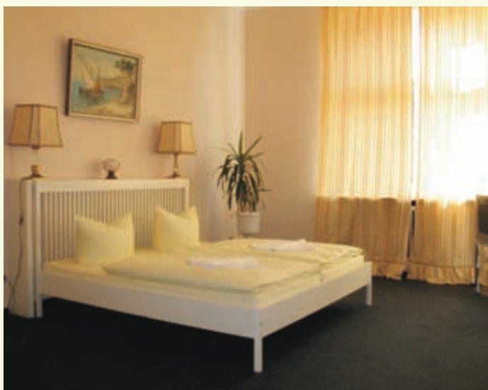
Doppelzimmer / double room